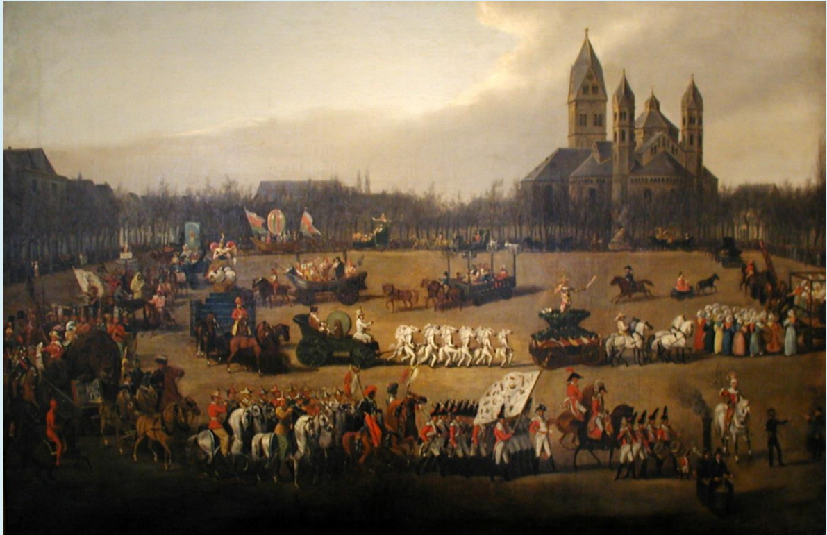
Gemälde Rosenmontagszug auf dem Neumarkt , Köln, 1836